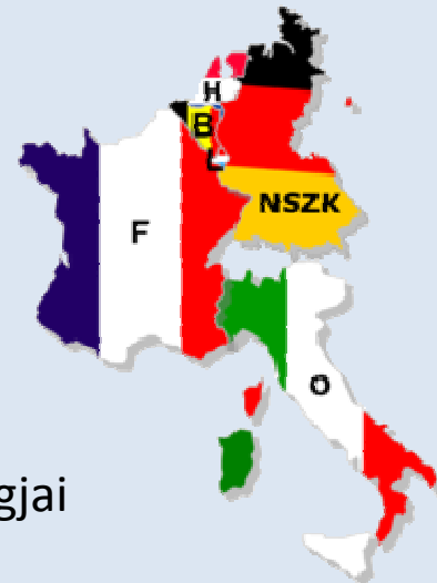
ESZAK alapító tagjai

Európa egyesítésének első lépésének tekintették az Európai Szén- és Acélközösség (ESZAK) megalapítását. Az 1951. április 19-i Párizsi szerződést aláíró alapító tagjai Belgium, Franciaország, Hollandia, Luxemburg, Nyugat-Németország és Olaszország. 1957-ben ez a hat ország aláírta a Római szerződést, és megalapította az Európai Gazdasági Közösséget (EGK), valamint az Európai Atomenergia Közösséget (Euratom). 1965-ben elfogadták az Egyesülési szerződést amely 1967 júliusában összevonta az ESZAK, az EGK és az Euratom intézményeit, amit közös néven Európai Közösségek -nek nevezünk.